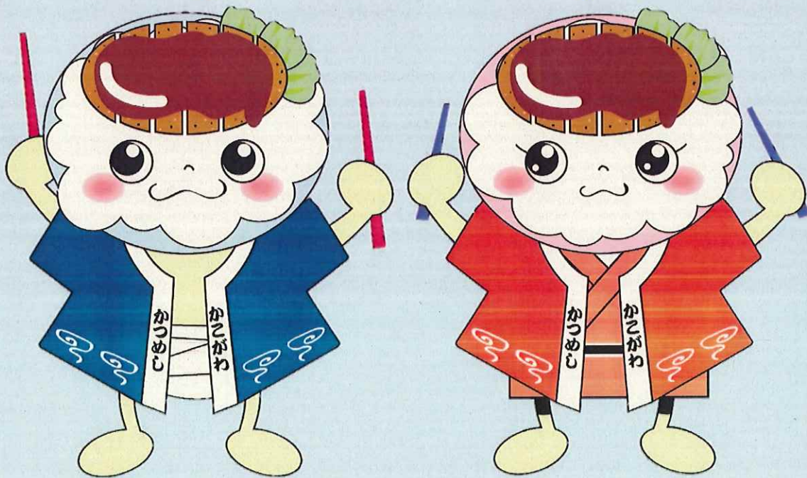
かつんとデミーちゃん