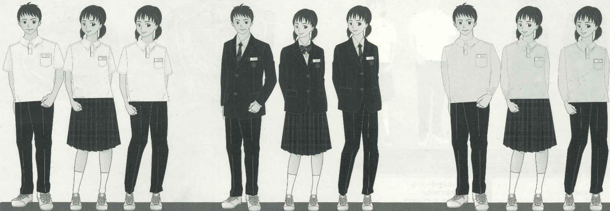
【スラックス】 黒ベルトを着用