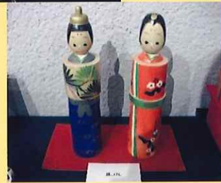
すべての写真は昨年の展示風景です。