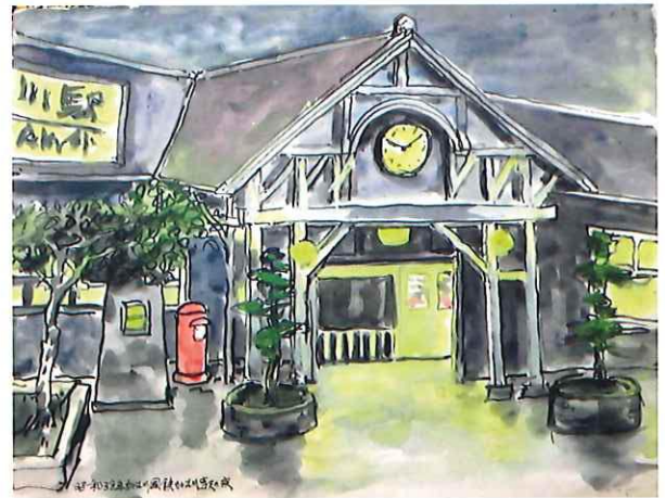
「(昭和38年)国鉄加古川駅の夜」