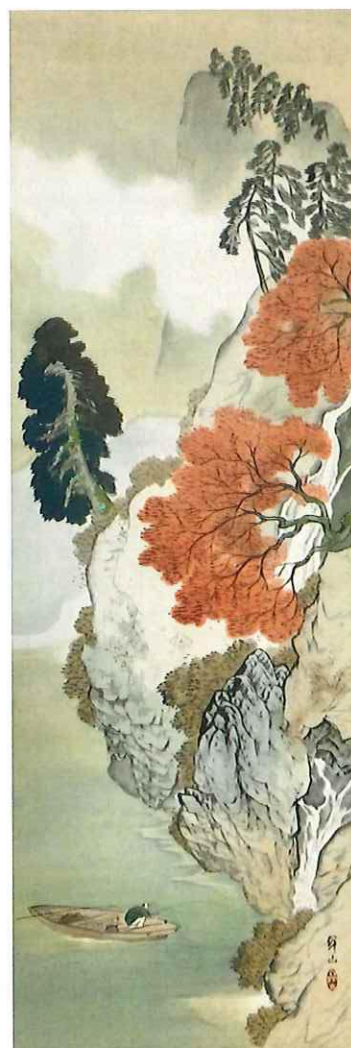
三木翠山「河畔秋色図」