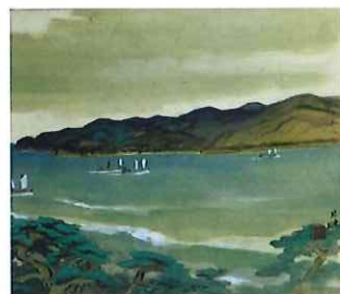
森月城「海浜風景(仮題)」