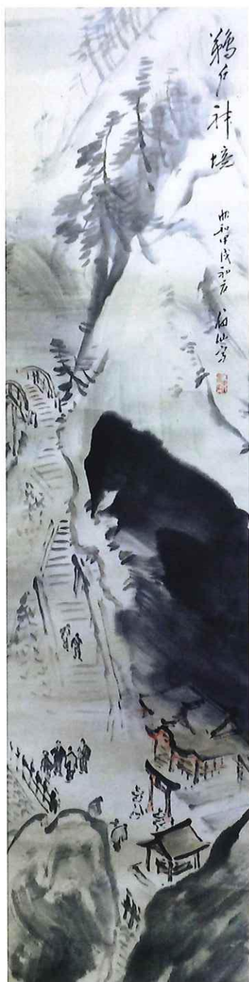
福田眉仙「鶴戸神境」