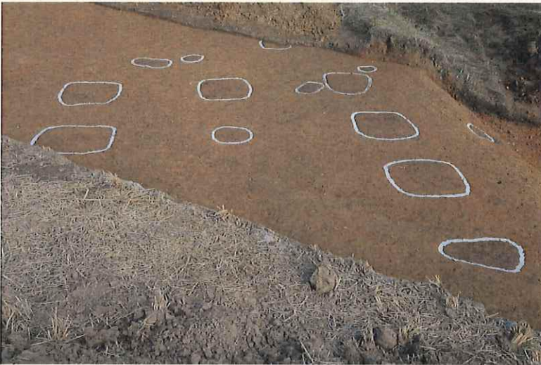
掘立柱建物跡検出状況 （西から）