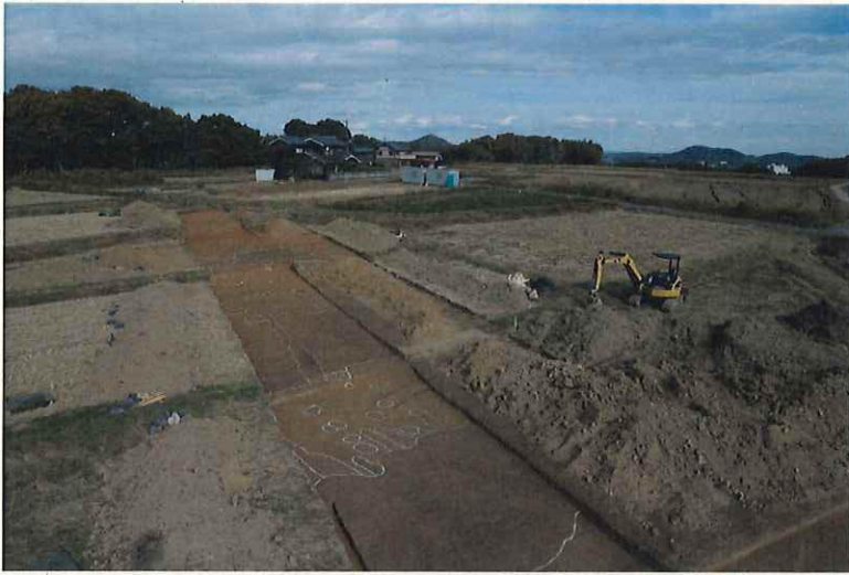
遺構検出状況（南から）