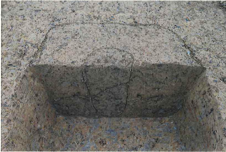
掘立柱建物の柱穴断面 (北から)