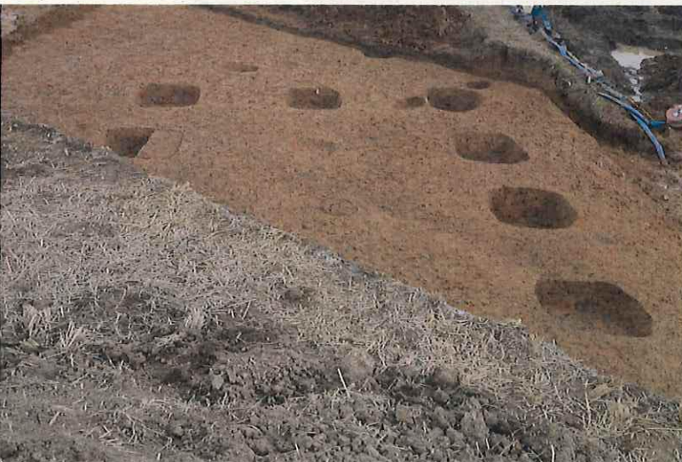
掘立柱建物跡掘削後 （西から）