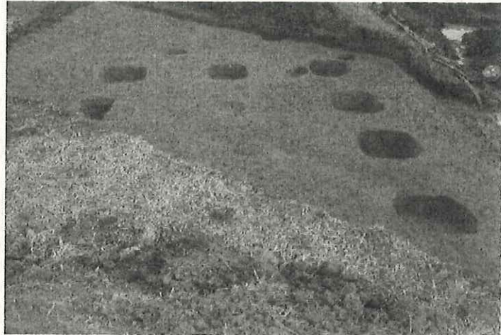
奈良時代の掘立柱建物跡

遺構の検出状況を実際に見る機会は唯一発掘現場だけです。この機会に多くの皆さまにご見学いただきたいと考えています。