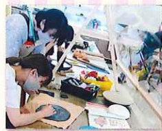
あお陶遊館アルテで 陶芸体験