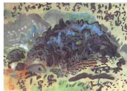
丸投三代吉 「ふるさと(仮題)」