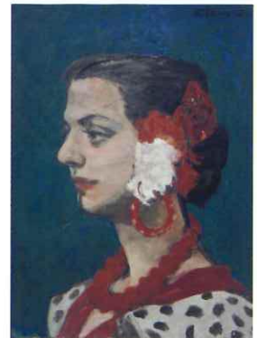
田村孝之介 「婦人像」