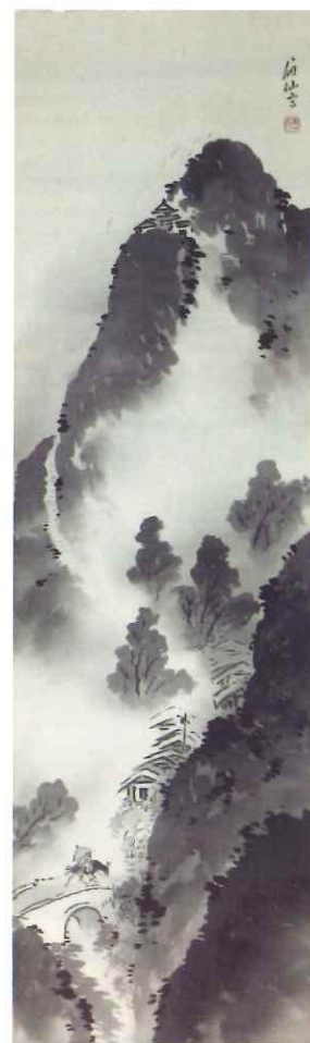
福田眉仙 「蜀道高梁吉図」