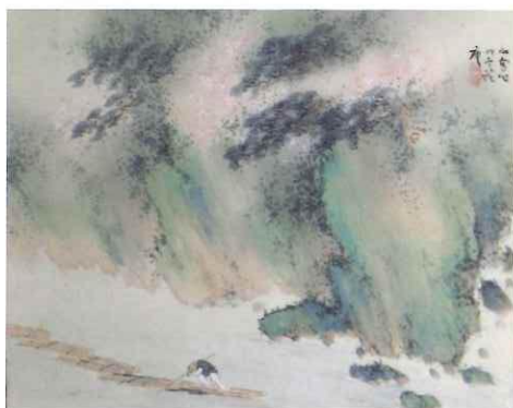
橋本関雪「溪山春色図」