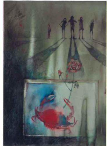
松本宏「カニとバラ」