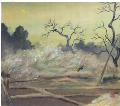
森月城「秋村新月図」