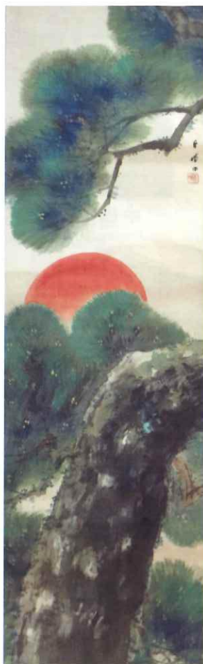
朝見香城 「朝陽に松」