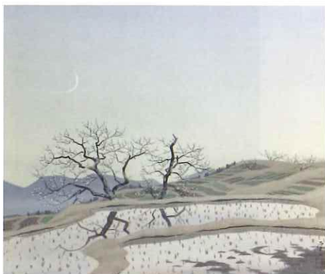
奥村厚一「棚田の月(仮題)」