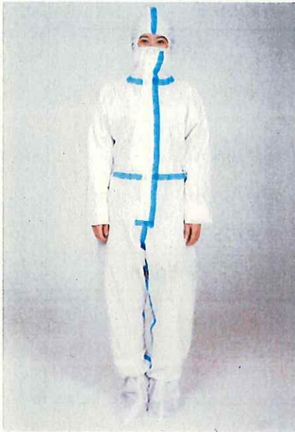
超あんしん防護服 目止めテープあり DYDD301