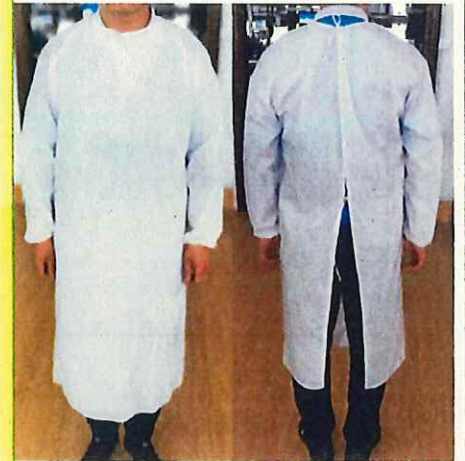
超あんしんアイソレー ションガウン DYDD303