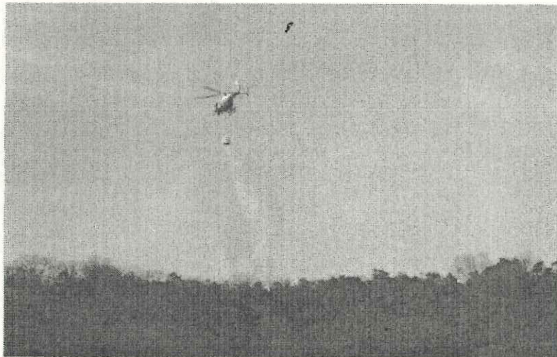
山からの放水写真