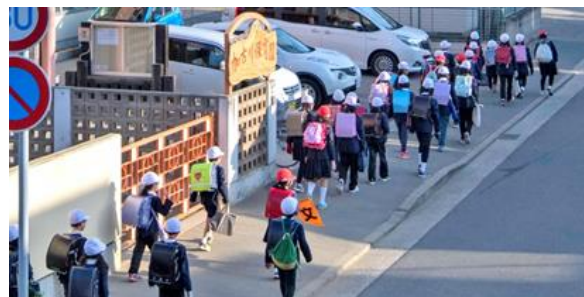
子どもたちの通学を見守る