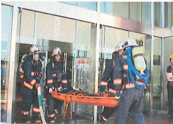
救助隊による要救助者救出