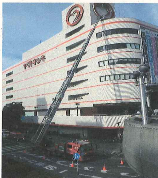
はしご車による救出訓練