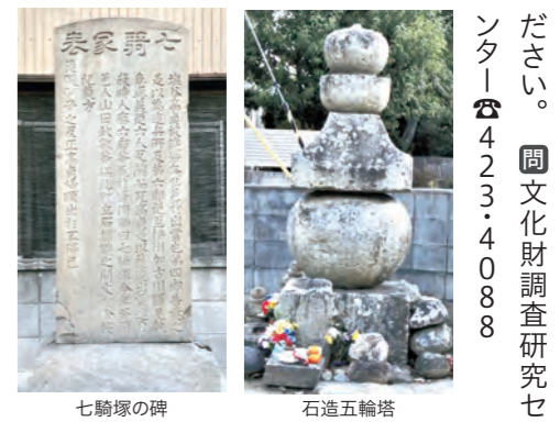
七騎塚の碑 石造五輪塔

申請をしてください。令和9年2月26日までに完了届を提出してください。 「石造五輪塔」などが市登録文化財に 平岡町新在家の「石造五輪塔」、米田町船頭の「七騎塚の碑」が市登録文化財に登録されました。