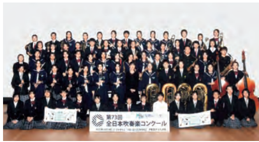
中部中学校・浜の宮中学校吹奏楽部