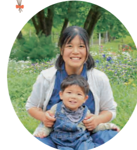
今月のファミリー

水に入ったり水遊びはできるのですが、水に飛び込むことを怖がっていたんです。でも、コーチや他のプール利用