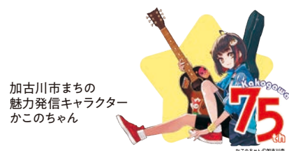
加古川市まちの 魅力発信キャラクター かこのちゃん