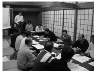
第 4 回協議会の様子

皆様には今後とも都染地区のまちづくりにご参加、ご協力くださいますようお願いいたします。