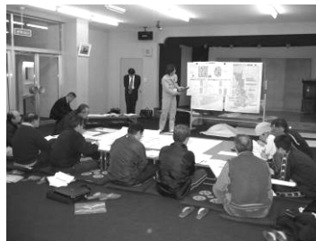
第4回協議会の様子