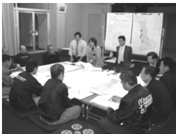
第5回協議会の様子

2月26日(火)都染公民館において、「第4回まちづくり協議会」を開催しました。町内住民の皆さん10名、市開発審査課職員2名、まちづくりアドバイザー3名が参加し、前回の意見を基に作成したまちづくり構想図、区分図について説明を行い、まちづくりの方針について意見交換を行いました。 また、3月26日(水)都染公民館にて、「第5回まちづくり協議会」を開催しました。町内住民の皆さん10名、市開発審査課職員2名、まちづくりアドバイザー2名が参加し、まちづくりに関する方針、まちづくり構想図、区分図について最終的な意見交換を行った後、来年度の活動について話し合いました。