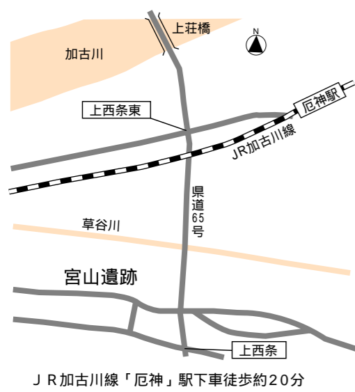
JR 加古川線「厄神」駅下車徒歩約20分

その後、昭和六十年に古墳の確認調査が行なわれました。中央部にある宮山大塚古墳は、五世紀後半に造られた帆立貝式古墳で、直径が約四十メートル、高さが約六メートルで、周囲を幅約六メートルの濠がめぐっていました。六世紀になると、宮山大塚古墳の周辺に宮山一号墳など六基の古墳が造られました。それらは直径が十五