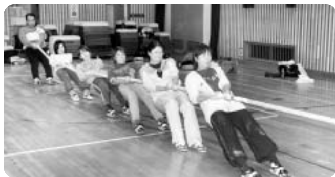
体験前は「オーエス」で引き合うと信じていた素人集団。でも、フォームも良くなって息もピッタリ! 楽しかった~。2月の出場ありかもよ~。

仲間と力を合わせる喜びを感じた今回の体験。綱を握り締め、綱に体を預け意識を集中していると、体は力