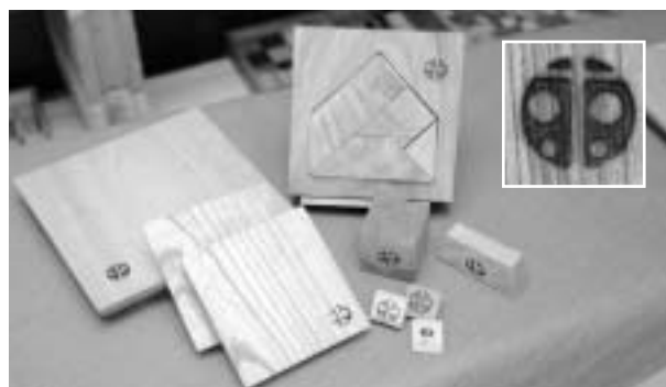
コースターや鍋敷きなどの雑貨も作っている。作品には、てんとう虫の焼印が押されている。