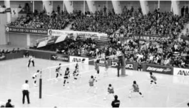
昨年11月に総合体育館で開催されたV・プレミアリーグ女子バレーボール加古川大会。約2,000人の観客が選手のみなさんに声援を送りました。

議長 私の地域では、世代間交流の一つとしてベタンクなどのニュースポーツをみんなで楽しんでいます。さまざまな世代の人が交流を深めていて、まさにスポーツを通じて「輪」が広がっていると感じます。