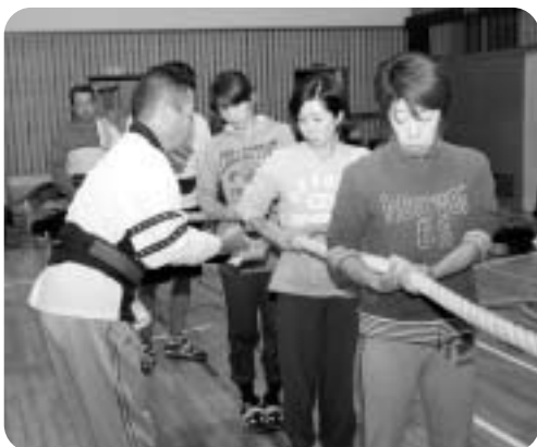
綱の握り方など、丁寧に教えてもらい技術は完ぺき? 後は気持ちいを合わせるだけやね。

毎年恒例の「加古川カップ綱引大会」。スポーツ好きの私は、参加してみたいと気になりつつ、今一步踏み出せずにいます。そこで、綱引大会についてくわしく知り、今年こそは! と、