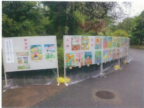
(ポスター・標語展示)