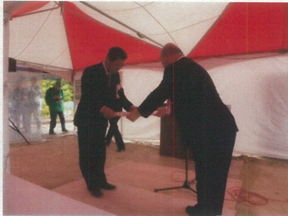
(緑化貢献団体やポスター・標語優秀賞表彰)