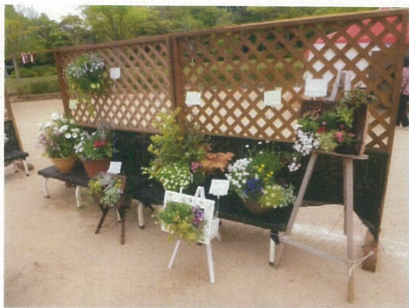
(ハンギング・コンテナ展)