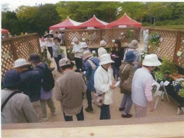
(来場者により投票)