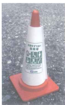
【駐車場での設置例】