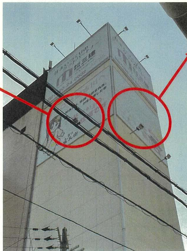
北面 (鶴林寺、水管橋など)