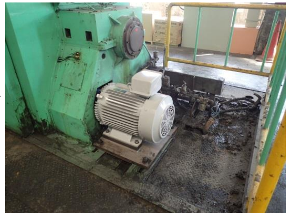
図1 撚線機 モーターインバータ化