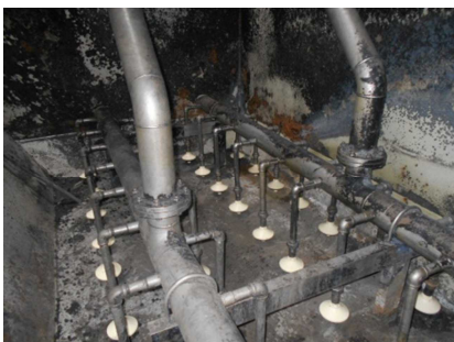
散気管取替後(写真③)