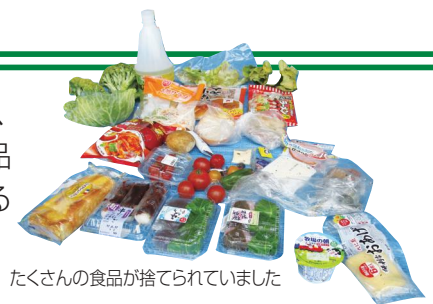
たくさんの食品が捨てられていました

昨年、ごみの実態調査を行ったところ、 手つかずのまま捨てられている未使用食品 が、燃やすごみ全体の 6% を占めている ことがわかりました。