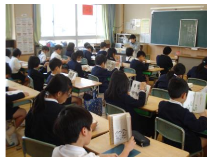
4年1組立野先生も読書

さらに、月一回を全校一斉読書タイムにしています。この日は、学級担任も読書をします。担任も読書をすることで、教室の中に一体感が生まれ、普段以上に本の世界に引き込まれていきます。集中力も増し、学習にも好影響を与えることが期待できます。