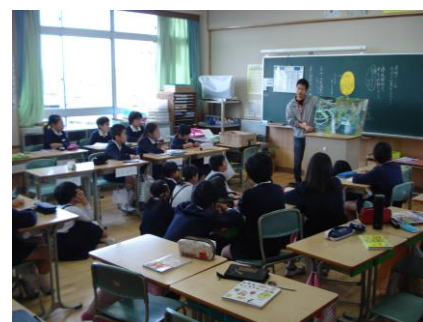
5年生に読み聞かせをする

もう一つの試みとして、担任交換による読み聞かせを実施しています。読み聞かせには、いろいろな世界にふれることで知的好奇心が刺激されるという良さがあります。さらに、担任とは違う教師が読み聞かせをすることで読書への関心が高まることが期待できます。学期に1回の実施を予定しています。