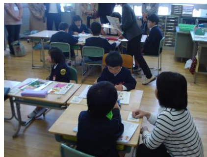
新しい仲間を迎えたなかよし学級

また、下校時には、不審者や大規模災害時を想定した保護者への引き渡し訓練を行いました。開始までに少しお待ちいただきましたが、整然とお待ちいただいている姿、真剣に放送を聞いている様子を見て、有意義な訓練ができると実感しました。子どもたちの安全を守るために、今後も訓練を通して防災意識が高まるよう指導を続けていきます。ご家庭でも、交通事故や身の回りの危険についてのお話をさせていただくことで、子どもたちへの意識付けの面で学校と足並みが揃います。よろしく願いいたします。